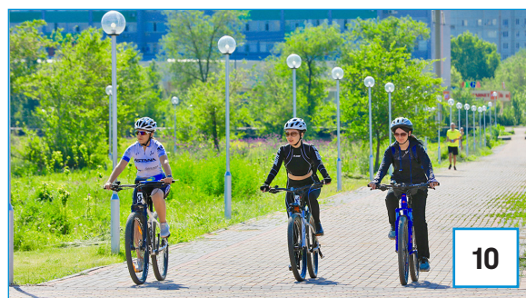
ТРИАТЛОН САЯБАҒЫ: ТЫНЫҒУ, ЖАТТЫҒУ, СЕРУЕН