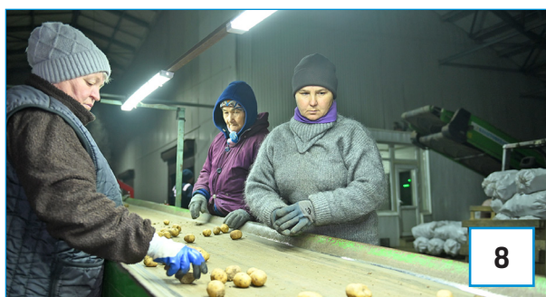
ҚОЛЖЕТІМДІ АЗЫҚ-ТҮЛІК: БАҒА ТҰРАҚТЫ, ҚОР ЖЕТКІЛІКТІ